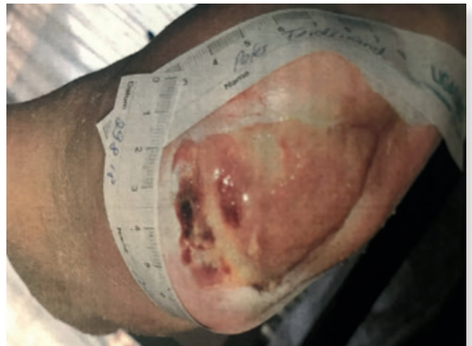
Abb. 8: Wundzustand am 29.08.2018 Z. n. chirurgischer Restnekrosenentfernung therapiebegleitend am 16.08.2018; Verband wie gehabt, Verbandswechselintervall dreitägig