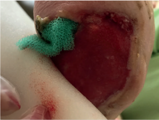
Abb. 5: Wundzustand am 14.08.2018 Tamponade der hartnäckigen, feuchten Nekrose weiterhin mit LIGASANO® grün steril. Zum Schutz des Granulationsgewebes wurde auf die Wundreinigung mit den LIGASANO® Wundputzern® verzichtet.