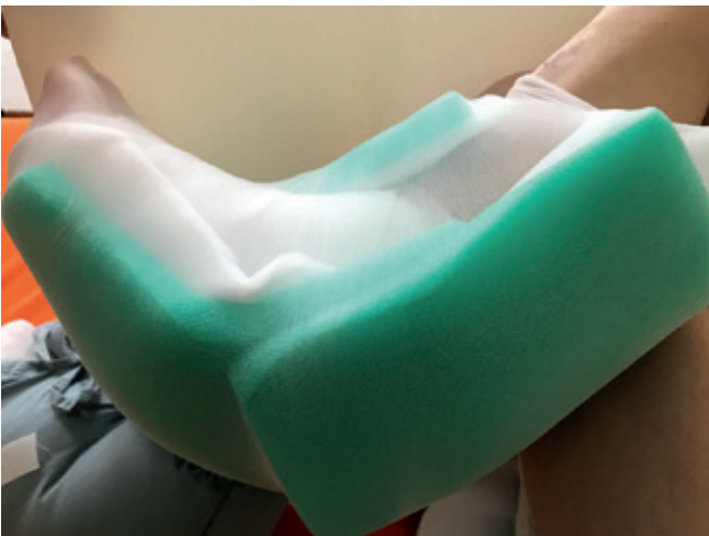
Abb. 7: 14.08.2018 Individuell angepasster Fersenschuh aus unsterilem LIGASANO® grün