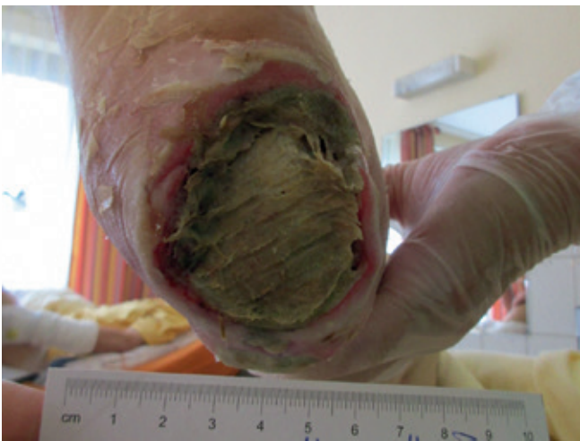
Abb. 1: Wundzustand am 26.04.2018

Wundreinigung: LIGASANO® Wundputzer® intensiv; Wundfüller: Nekrotischer Bereich mit LIGASANO® grün steril, übriger Wundbereich mit LIGASANO® weiß steril, 1 cm dick; Wundabdeckung: LIGASANO® weiß unsteril plus LIGASANO® Binde 10 cm breit