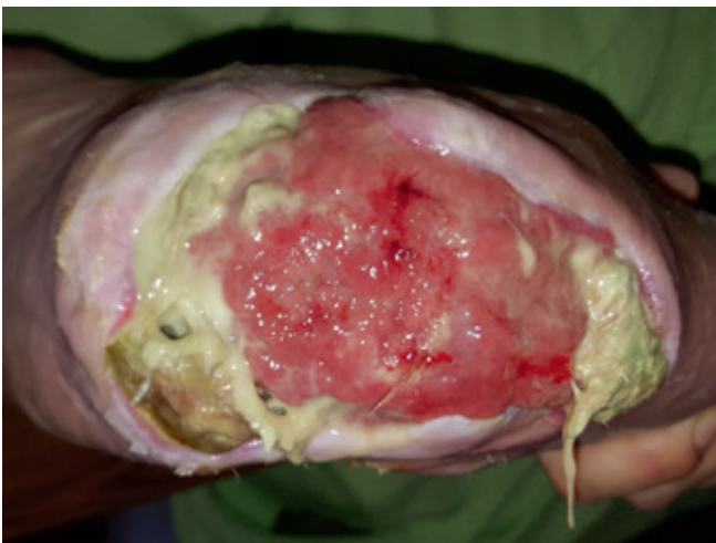
Abb. 3: Wundzustand am 05.07.2018

Z. n. ambulanter Nekroseabtragung. Weiterhin tiefe Strukturen betroffen, mit entzündlichen Prozessen und starkem Wundgeruch. Therapieempfehlung des Krankenhauses: Amputation Ab 19.06.2018 Beginn der Wundbehandlung mit LIGASANO®.